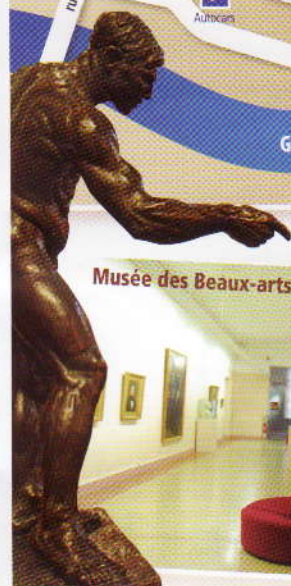
Musée des Beaux-arts (E4)