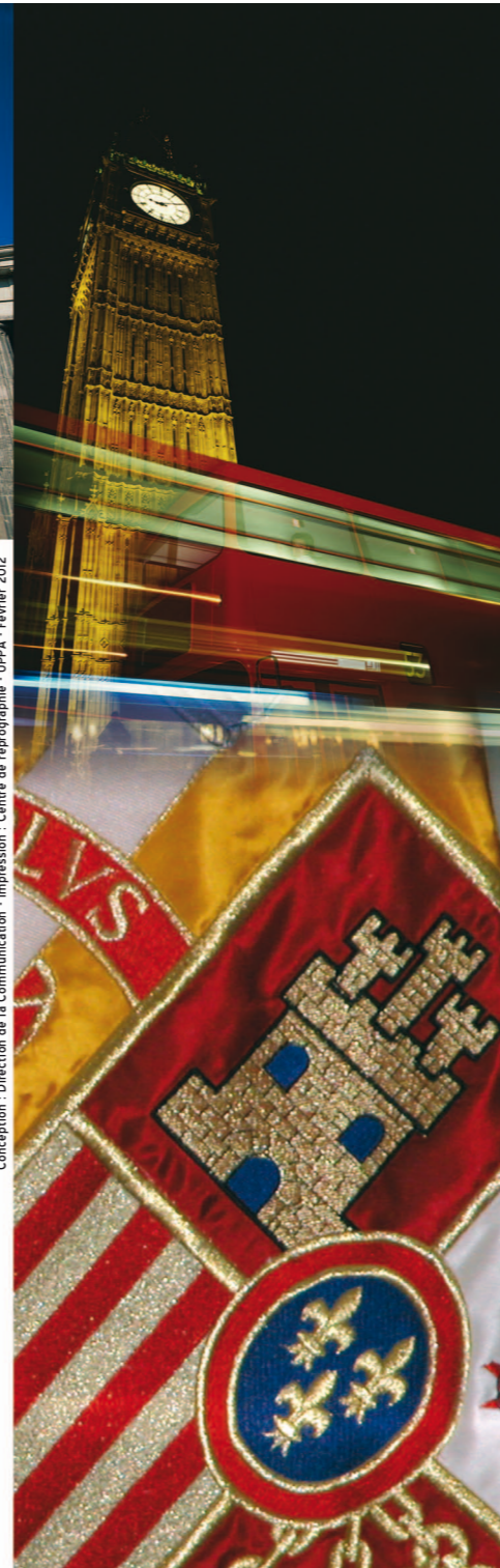
Conception : Direction de la Communication - Impression : Centre de reprographie - UPPA - février 2012